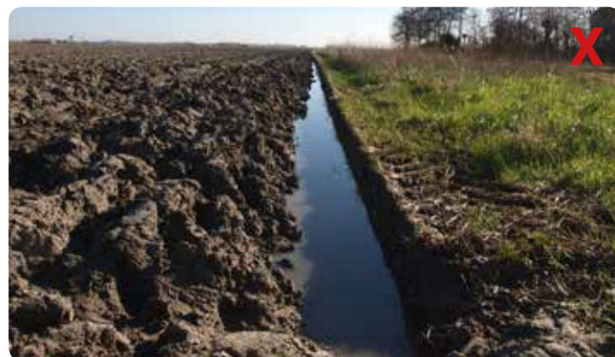
Stagnerend water op de ploegzool door ondergrondverdichting. Dit veroorzaakt structuurbederf en opbrengstverlies van het gewas.

Door de ondiepere beworteling kan de beregeningsbehoefte verdubbelen, waardoor de grondwatervoorraad sterk wordt aangesproken. De grondwaterstand wordt door ondergrondverdichting onvoldoende aangevuld. Drains lopen niet door deze diepe grondwaterstanden.